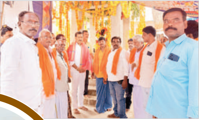
కొల్లాపూర్ : ఎల్లూరులో వాల్మీకి విగ్రహ ప్రతిష్ఠాలో ఎమ్మెల్యేను సన్మానిస్తున్న నిర్వాహకులు