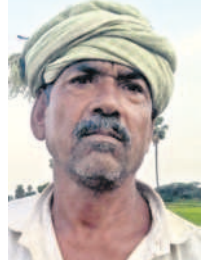
- భానునాయక్, రామునిబండతండా, తిరుమలగిరి