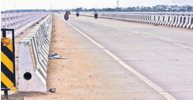
మానాయికుంట-గురజాల మధ్య ముసీ నదిపై నిర్మించిన బ్రిడ్జి

జించడం జరిగింది. తిరుమలగిరి, మోతూర్ మున్సిపాలిటీలుగా ఏర్పడి రూ.100 కోట్లతో అభివృద్ధి జరిగాయి. అలాగే తిరుమలగిరి, నాగారం, అర్రపల్లి, తుంగతుర్తి, నూతనకల్, మద్దిరాల మండలాలు సూర్యాపేట జిల్లాలో చేరాయి. మోతూర్, అడ్లగూడూరు, యాదాద్రి భువనగిరిలో చేరగా శాలిగౌరారం నల్లగొండ జిల్లాలో ఉంది. కొత్త రెవెన్యూ డివిజన్ల ఏర్పాటు తర్వాత శాలిగౌరారం నల్లగొండ రెవెన్యూ డివిజన్లోకి, అడ్లగూడూరు, మోతూర్ యాదాద్రి భువనగిరి, తిరుమలగిరి, నాగారం, జాజిరెడ్డిగూడెం, తుంగతుర్తి, నూతనకల్, మద్దిరాల మండలాలు సూర్యాపేట రెవెన్యూ డివిజన్ పరిధిలోకి వెళ్లడంతో ప్రజలకు దూరభారం తగ్గింది.