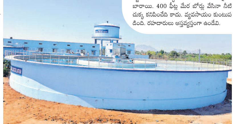
నూతనకల్లో ఏర్పాటు చేసిన మిషన్ భగీరథ ఫిల్టర్ బెడ్

కేసీఆర్ సారు వచ్చినంకనే మా బతుకులు బాగుపడ్డాయి. ఏండ్ల నుంచి అరిగోస పడ్డాం. ఇప్పుడు ఆ బాధలు తీరినయి. 25 ఏండ్ల కింద నీళ్లు లేక మావాళ్లు వ్యవసాయ భూమి అమ్ముతే 5 వేలకు ఎకరం చొప్పున ఏడెకరాలు కొన్నాను. ఆరోజు ఏడెకరాలకు పెట్టిన డబ్బుతో ఈరోజు ఎకరం కూడా కొనలేని పరిస్థితి. ఇదంతా సీఎం కేసీఆర్ సారు పుణ్యమే. చెరువులు, కుంటలు నిండి ఎక్కడ చూసినా నీళ్లు కనిపిస్తున్నాయి. ఏ బోరు పెట్టినా నీళ్లు తన్నుకొస్తున్నాయి. ఇప్పుడు ఎకరం భూమి 30 నుంచి 50 లక్షలు పలుకుతుంది. వ్యవసాయం జోరుగా సాగుతుంది. పంటలు బాగా పండుతున్నాయి. కేసీఆర్ సారుకు రుణపడి ఉంటాం.