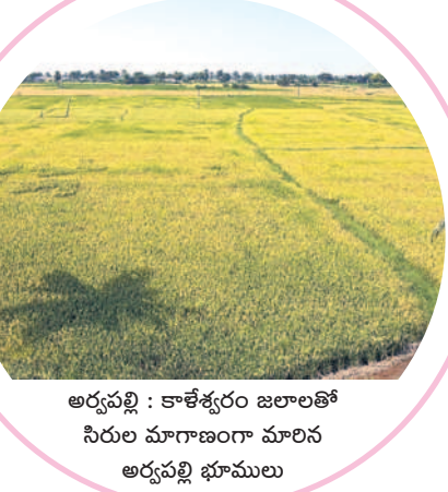
అర్రపల్లి : కాళేశ్వరం జలాలతో సిరుల మాగాణంగా మాలిన అర్రపల్లి భూములు

2014కు ముందు నియోజకవర్గంలో సాగునీరు లేక వ్యవసాయ భూములు పడావు పడ్డాయి. అమ్ముడా మంటే కొనేవారు లేక రైతులు అవస్థలు పడ్డారు. అలాంటి భూములకు కాళేశ్వరం నుంచి గోదావరి జిల్లా రావడంతో నేడు బంగారు పంటలు పండుతున్నాయి. నాడు ఎకరానికి 25 వేల నుంచి 50 వేల పలికిన ధరలు నేడు 30 లక్షల నుంచి కోటి రూపాయల వరకు పెరిగాయి. నాడు భూములు అమ్ముదామంటే కొనేవారు లేకపోగా, నేడు కొందామంటే అమ్మేవారు లేని పరిస్థితి నెలకొంది.