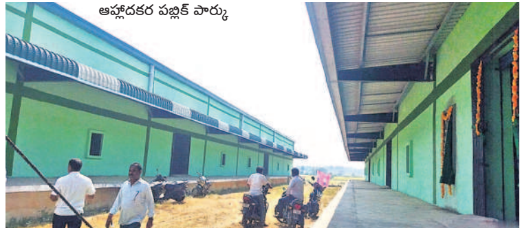
చిలుకూరులో గోదాముల నిర్మాణం