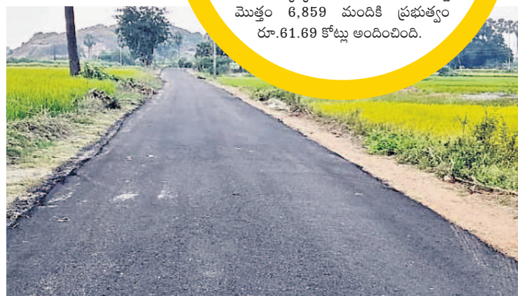
నడిగూడెం నుంచి రామాచంద్రాపురం వరకు బీటీ రోడ్డు