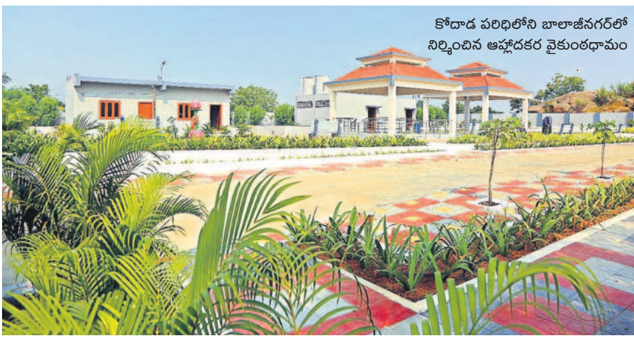
కోదాడ పరిధిలోని బాలాజీనగర్లో నిర్మించిన ఆహ్లాదకర వైకుంఠధామం