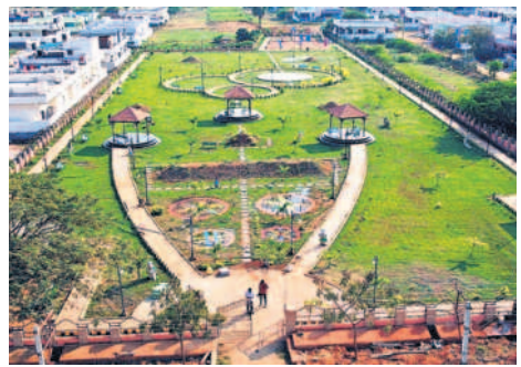
కోదాడ మున్సిపాలిటీ పరిధిలోని ఆహ్లాదకర పబ్లిక్ పార్కు

నియోజకవర్గ వ్యాప్తంగా రూ.75 కోట్లతో 1,400 డబుల్ బెడ్రూం ఇండ్లను లభిదారులకు అందజేశారు. వీటితోపాటు మరో 1,400 ఇండ్ల మంజూరుకు ప్రభుత్వం నుంచి గ్రీన్ సిగ్నల్ లభించింది. కోదాడ టౌన్లో 520, రూరల్లో 508, చిలుకూరు 200, మునగాల 250, నడిగూడెం 150, మోతె మండలంలో 170 ఇండ్లను అందజేశారు.