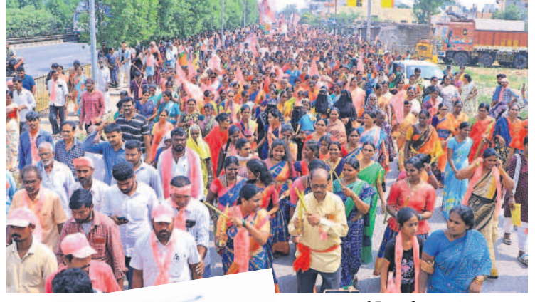
చిట్యాల రోడ్ షోలో పాల్గొన్న ప్రజలు