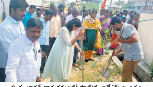
స్వచ్ఛ భారత్ కార్యక్రమంలో పాల్గొన్న ఐకేఎఫ్ బృందం