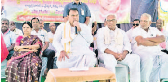
కమ్మ కులస్తుల ఆత్మీయ సమ్మేళనంలో మాట్లాడుతున్న స్పీకర్ పోచారం