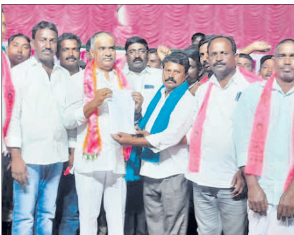
మంత్రి వేములకు ఏకగ్రీవ తీర్మానంపత్రం అందజేస్తున్న సంఘ సభ్యులు

బాల్కొండ, అక్టోబర్ 28 : మండలంలోని నాగపూర్ గ్రామానికి చెందిన తాంబూర్ మున్నూరుకాపు సంఘంలోని 53 కుటుంబాలు మంత్రి ప్రశాంత్ రెడ్డికి మద్దతుగా ఏకగ్రీవ తీర్మానం కాపీని మండల కేంద్రంలో అందజేశారు. రాబోయే ఎన్నికల్లో మంత్రికి మద్దతుగా నిలుస్తామని అన్నారు.