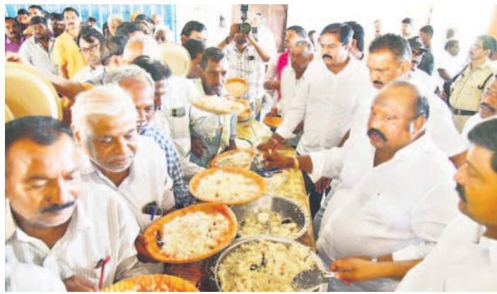
కలింగం: అర్జీని సమ్మేళనంలో భోజనం వడ్డిస్తున్న జిల్లా అధ్యక్షులు, మంత్రి గంగుల కమలాకర్