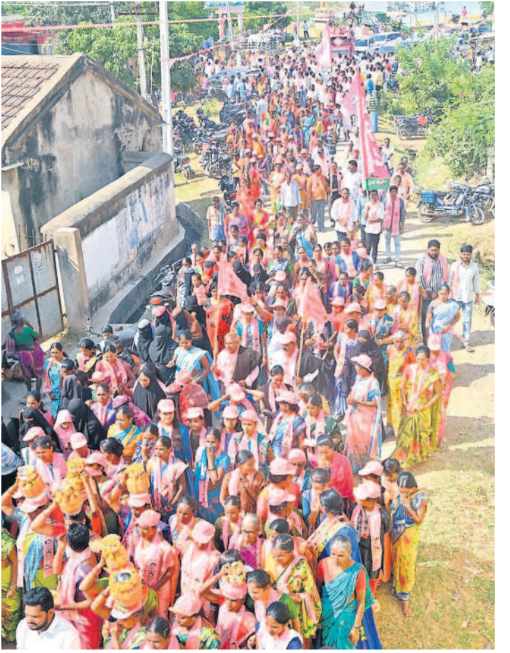
కథలాపూరు: శాంతి యాదవులు జిల్లా అధ్యక్షులు, ఎమ్మెల్యే చాపపండి జిల్లా అధ్యక్షులు, ఎమ్మెల్యే సుంకె రవిశంకర్