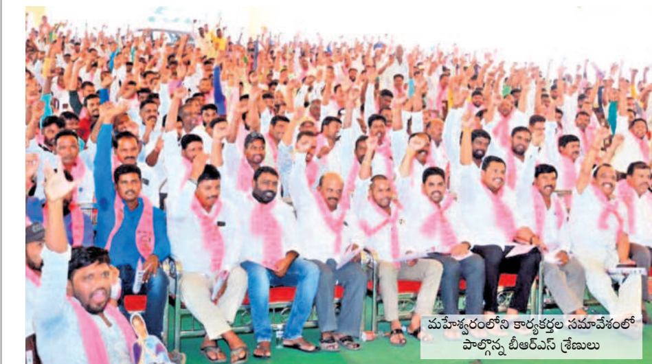
మహేశ్వరంలోని కార్యక్రమ సమావేశంలో పాల్గొన్న బీఆర్ఎస్ శ్రేణులు