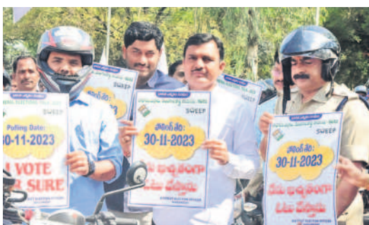
సంగారెడ్డిలో నేను ఓటు వేస్తాను పోస్టరు ఆవిష్కరిస్తున్న సంగారెడ్డి ఎన్నికల అధికారి శరత్, అధికారులు