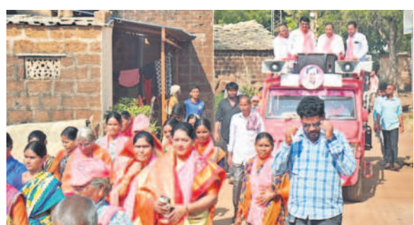
మొగుడంపల్లి మండలంలోని గౌసాబాద్ తండాలో ప్రచారం చేస్తున్న ఎమ్మెల్యే మాణిక్ రావు