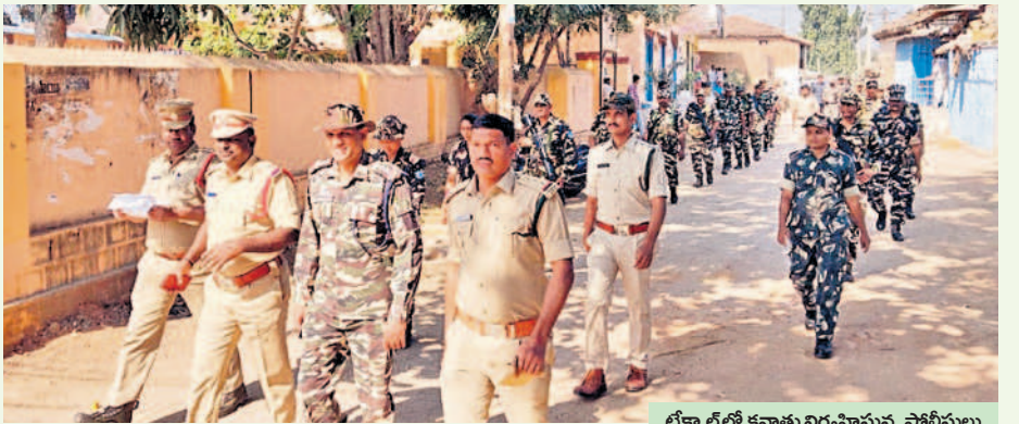
టేక్నాలజీలో కవాతు నిర్వహిస్తున్న పోలీసులు