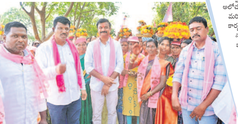
రాయపాల్ మండలం చిన్నమాసాన్ పల్లిలో బతుకమ్మలతో ఎంపీకి స్వాగతం పలుకుతున్న మహిళలు