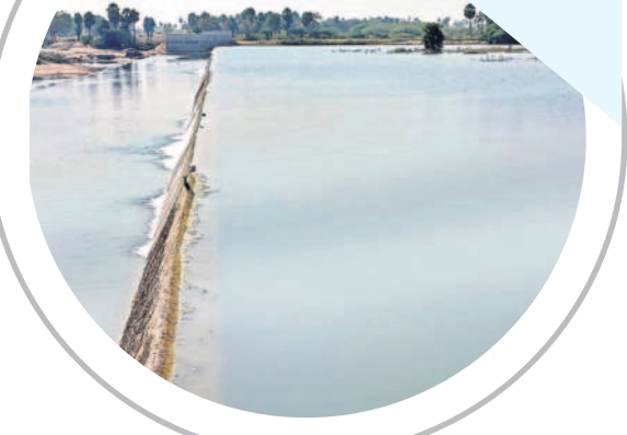
తిరుమలగిరి-అనంతారం మధ్య బిక్కేరు వాగుపై మత్తడి దుంకుతున్న చెక్ డ్యామ్