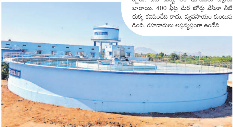
నూతనకల్లో ఏర్పాటు చేసిన మిషన్ భగీరథ ఫిల్టర్ బెడ్