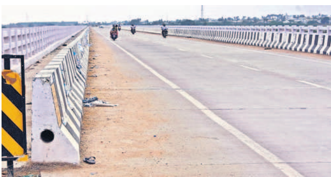
మానాయికుంట-గురజాల మధ్య ముసీ నదిపై నిర్మించిన బ్రిడ్జి

జించడం జరిగింది. తిరుమలగిరి, మోతూర్ మున్సిపాలిటీలుగా ఏర్పడి రూ.100 కోట్లతో అభివృద్ధి జరిగాయి. అలాగే తిరుమలగిరి, నాగారం, అర్బన్, తుంగతుర్తి, నూతనకల్, మద్దిరాల మండలాలు సూర్యాపేట జిల్లాలో చేరాయి. మోతూర్, అడ్లగూడూరు, యాదాద్రి భువనగిరిలో చేరగా శాలిగౌరారం నల్లగొండ జిల్లాలో ఉంది. కొత్త రెవెన్యూ డివిజన్ల ఏర్పాటు తర్వాత శాలిగౌరారం నల్లగొండ రెవెన్యూ డివిజన్లోకి, అడ్లగూడూరు, మోతూర్ యాదాద్రి భువనగిరి, తిరుమలగిరి, నాగారం, జాజిరెడ్డిగూడెం, తుంగతుర్తి, నూతనకల్, మద్దిరాల మండలాలు సూర్యాపేట రెవెన్యూ డివిజన్ పరిధిలోకి వెళ్లడంతో ప్రజలకు దూరభారం తగ్గింది.