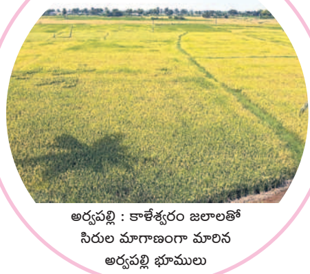
అర్బన్ : కాళేశ్వరం జలాలతో సిరుల మాగాణంగా మాలిన అర్బన్ భూములు

ఆరు దశాబ్దాల్లో జరుగని అభివృద్ధి తొమ్మిదిన్నరేండ్లలోనే..