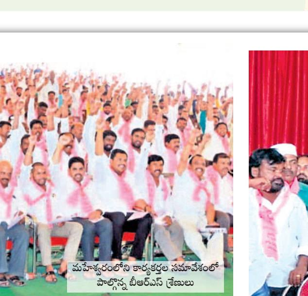
మహేశ్వరంలోని కార్యక్రమ సమావేశంలో పాల్గొన్న బీఆర్ఎస్ శ్రేణులు