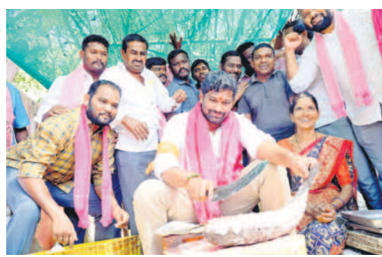
చేపల దుకాణంలో చేపలు అమ్ముతూ..