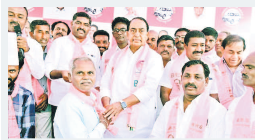
సారంగాపూర్ : నాయకులను బీఆర్ఎస్ పార్టీలోకి ఆహ్వానిస్తున్న మంత్రి ఇంద్రకరణ్ రెడ్డి