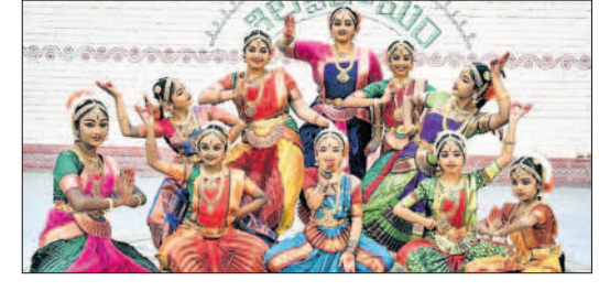
వారాంతపు సాంస్కృతిక కార్యక్రమాల్లో భాగంగా ఆదివారం మాదా పూర్లోని శిల్పారామంలో కళాకారుల నృత్య ప్రదర్శనలు సందర్శకులను ఎంతగానో ఆకట్టుకున్నాయి. - కొండాపూర్, అక్టోబర్ 29