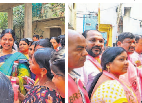
హైమద్నగర్లో మంగళహారతులతో స్వాగతం పలుకుతున్న మహిళలు