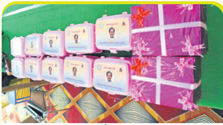
గర్భిణులు అందుకున్న కేసీఆర్ న్యూట్రీషన్ కిట్లు ( ఫైల్ )

భద్రాద్రి కొత్తగూడెం, అక్టోబర్ 29 (నమస్తే తెలంగాణ) : బిడ్డ కడుపులో పడినప్పటి నుంచి గర్భిణికి మంచి పోషకాలు అందించే తల్లి కడుపులో ఆరోగ్యంగా ఎదుగుతుంది. ఎలాంటి పోషకాలు, పాస్టికాహారం తీసుకోలేని పేద గర్భిణులు ప్రసవ సమయంలో ఇబ్బంది పడడం..