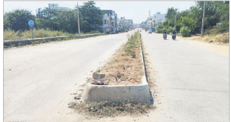
మధురానగర్ చౌరస్తాలో పూర్తయిన డబుల్ రోడ్డు