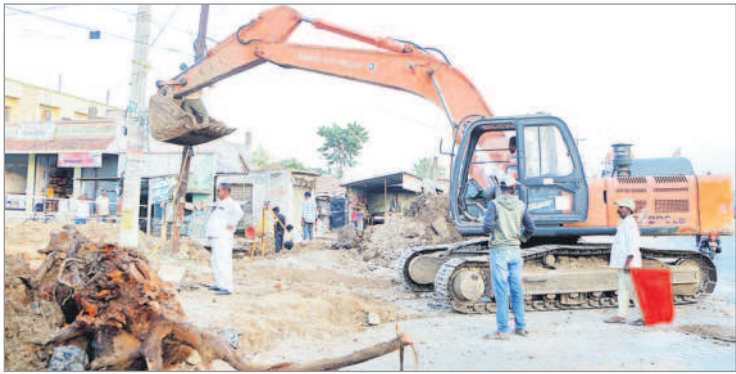
పట్టణంలో జరుగుతున్న రోడ్డు విస్తరణ పనులు

చొప్పదండి, అక్టోబర్ 29: చొప్పదండి మేజర్ గ్రామ పంచాయతీ నుంచి మున్సిపల్ గా అప్ గ్రేడ్ అయిన తర్వాత మొదటిసారిగా నిర్వహించిన