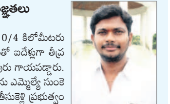
-వేముల అంజ, మధురానగర్

మండల కేంద్రానికి వెళ్లే దారిలో 0/0 నుంచి 0/4 కిలోమీటరు వరకు రహదారి పనులు అసంపూర్ణంగా ఉండడంతో ఐదేళ్లుగా తీవ్ర ఇబ్బందులు పడ్డాము. ప్రమాదాలు జరిగి పలువురు గాయపడ్డారు. చౌరస్తాలోని ప్రజలు, వాహనదారుల ఇబ్బందులను ఎమ్మెల్యే సుంకె రవిశంకర్ కు విన్నవించగా, సీఎం కేసీఆర్ దృష్టికి తీసుకెళ్లి ప్రభుత్వం ద్వారా రోడ్డు నిర్మాణానికి రూ. 2.33 కోట్లు మంజూరు చేయించారు. నిధులు మంజూరు చేసిన సీఎం కేసీఆర్ కు ఇందుకు కృషి చేసిన ఎమ్మెల్యే రవిశంకర్ కు మధురానగర్ ప్రజల తరపున కృతజ్ఞతలు.