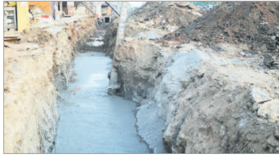
రహదారి పక్కన నిల్వస్తున్న మురుగు కాలువ