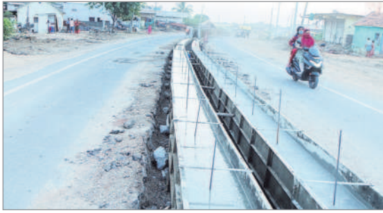
సెంట్రల్ లైటింగ్ కోసం రహదారి మధ్యలో నిల్వస్తున్న డివైడర్లు