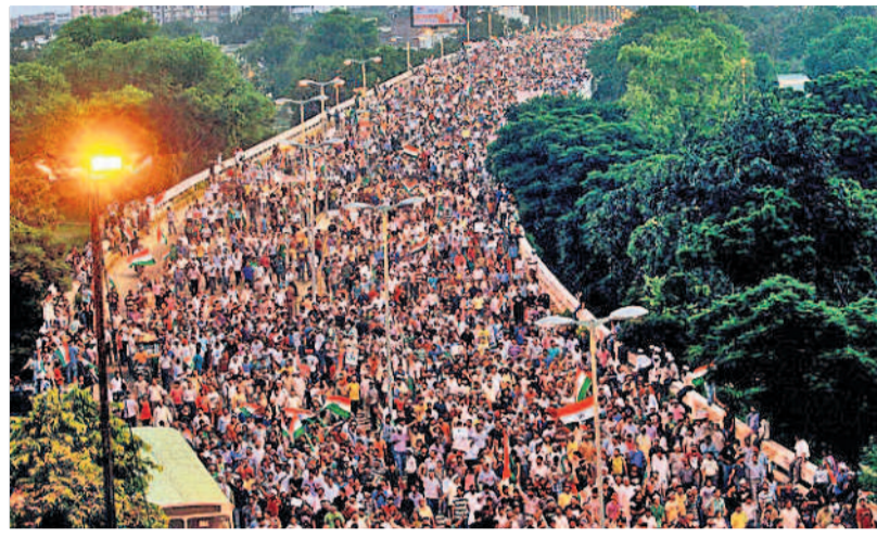
వచ్చులు సమీపపుడు కూడా తెలంగాణ కాంగ్రెస్ నాయకులది మాన ప్రత్యేక పాత్ర!

రులతో మాట్లాడుతూ.. 'నెహ్రూ సాబ్ చెప్పిన తర్వాత తానేమీ మాట్లాడలేకపోయాననీ, మజార్లోలో 'ఒప్పుకున్నాననీ' అన్నాడు. ఇదంతా చరిత్ర. తెలంగాణను ఉడగొట్టింది కాంగ్రెస్ పార్టీనే అని చెప్పక చెప్పే చరిత్ర.