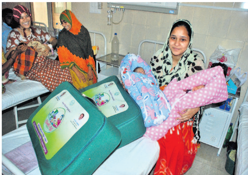
అమ్మ ఒడి వాహన సేవలు

గర్భిణులు సురక్షితంగా దవాఖానకు వెళ్లి, చెక్ చేయించుకొని తిరిగి ఇంటికి చేర్చేందుకు సీఎం కేసీఆర్ ఈ పథకానికి శ్రీకారం చుట్టారు.