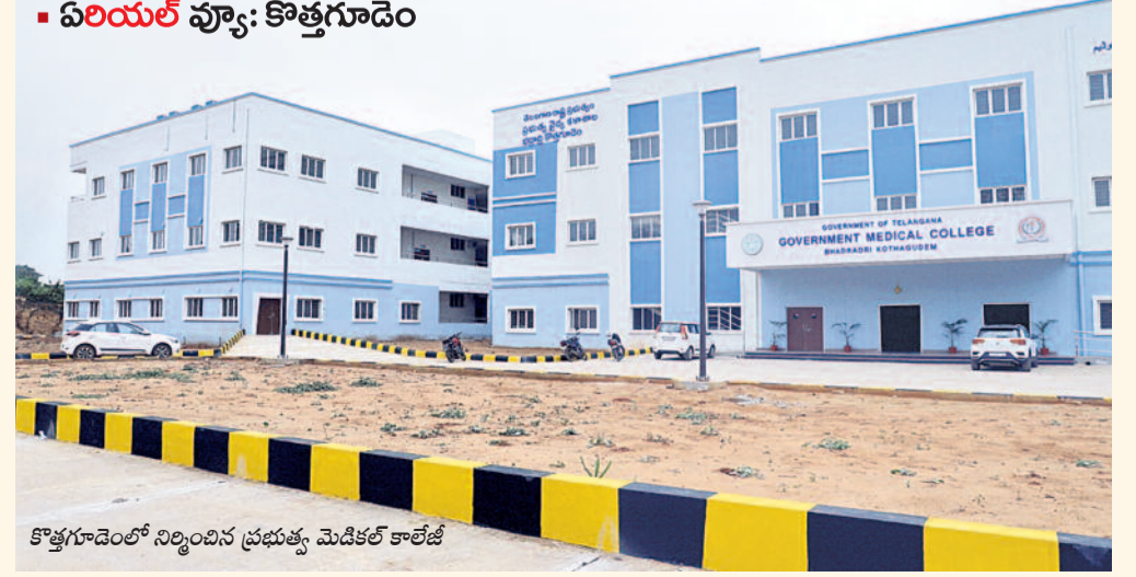
కొత్తగూడెంలో నిర్మించిన ప్రభుత్వ మెడికల్ కాలేజీ