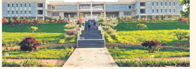
అత్యున్నత వనరులతో నిర్మించిన సమీకృత కర్మశాల భవనం