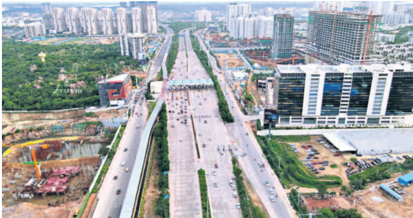
నానకరాంగూడ ఓఆర్ఆర్ టోల్ ప్లాజా దాటిన తర్వాత కొత్తగా ర్యాంపును నిర్మించిన హెచ్ఎంఓ

సిటీబ్యూరో, అక్టోబర్ 29 (నమస్తే తెలంగాణ): ఐటీ కారిడార్ లో ట్రాఫిక్ సమస్య నివారణకు కొత్త రోడ్డు నిర్మాణంపై ప్రభుత్వం దృష్టి సారించింది. రోజు రోజుకూ పెరుగుతున్న ట్రాఫిక్ ను దృష్టిలో పెట్టుకొని ఆయా ప్రాంతాల్లో ప్రత్యామ్నాయ మార్గాలను త్వరితగతిన అందుబాటులోకి తీసుకువచ్చేలా పురపాలక శాఖ అధికారులు ప్రణాళికలు రూపొందిస్తున్నారు. ముఖ్యంగా 9 ఏళ్లలో ఐటీ కారిడార్ మాదాపూర్, రాయదుర్గం, గచ్చిబౌలి వైపు నుంచి ఫైనాన్సియల్ డిస్ట్రిక్, కోకాపేట, పుష్పాల్ గూడ వరకు విస్తరించడంతో నానకరాంగూడ ఔటర్ రింగు రోడ్డు ఇంటర్చేంజ్ వద్ద ట్రాఫిక్ రద్దీ గణనీయంగా పెరిగింది. దీంతో ఔటర్ మీదుగా వచ్చే వాహనాలకు తోడు, కోర్ సిటీ నుంచి వచ్చే వాహనాలతో నానకరాంగూడ ఇంటర్చేంజ్ వద్ద ఇరువైపులా ఉన్న రోటరీ వద్ద ట్రాఫిక్ జామ్ సమస్య నిత్యం ఇబ్బంది పెట్టింది. ఈ విషయాన్ని గుర్తించిన హైదరాబాద్ మెట్రో పాలిటెన్ డెవలప్ మెంట్ అథారిటీ (హెచ్ఎంఓ) అధికారులు ప్రత్యామ్నాయ రోడ్డు మార్గాలను అందుబాటులోకి తీసుకువచ్చారు. ఇందులో మొదటగా శంషాబాద్ ఎయిర్పోర్టు నుంచి వచ్చే వాహనాలను నానకరాంగూడ ఓఆర్ఆర్ ఇంటర్చేంజ్ వరకు రాకుండా.. నార్సింగి వద్ద ఒక ఇంటర్చేంజ్ ను నిర్మించారు. మరో ర్యాంపును నానకరాంగూడ ఓఆర్ఆర్