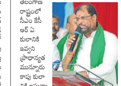
మున్నూరుకాపుల సంక్షేమానికి పెద్దపీట..