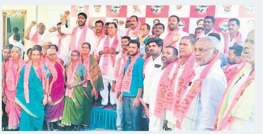
లక్ష్మణవాండ : బీఆర్ఎస్ లో చేరిన యాదవ సంఘ సభ్యులతో..