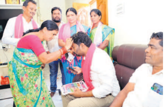
ప్రచారంలో బొట్టు పెట్టి ఆహ్వానిస్తున్న ప్రజలు

భారీ పోలిక దక్కా.. బీఆర్ఎస్ హ్యూట్రీక్ పక్కా