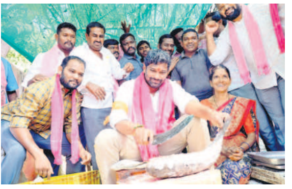
చేపల దుకాణంలో చేపలు అమ్ముతూ..