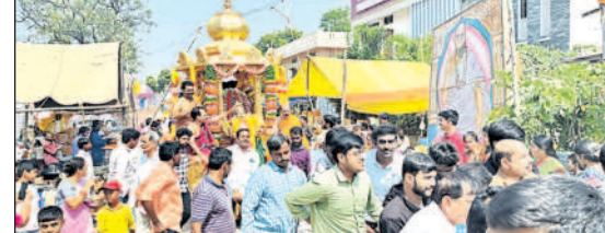
గరుడ సేవపై దర్శనమిస్తున్న వేంకటేశ్వర స్వామి