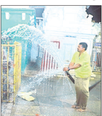
ధ్వజస్తంభం వద్ద శుద్ధి చేస్తున్న ఆలయ సిబ్బంది