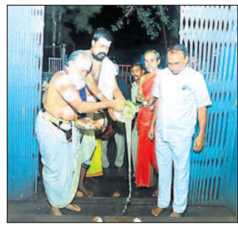
ఆలయ ప్రధాన ధ్వారం ముందు సంప్రోక్షణ పూజలు నిర్వహిస్తున్న అర్చకులు

పూజలు, శుద్ధి చేసిన అనంతరం ప్రాతఃకాల పూజ నిర్వహించారు. అనంతరం భక్తులకు స్వామివారి దర్శనానికి అనుమతిం చారు. రాజన్న ఆలయంలో పాటు అనుబంధ ఆలయాలైన శ్రీ భీమేశ్వరాలయం, బద్దిపోచమ్మ, సంగరేశ్వరాలయం, మహాలక్ష్మి లయం, నాంపెల్లి నర్సింహస్వామి వారి ఆలయాల్లో కూడా సంప్రోక్షణ పూజలు నిర్వహించి ఆలయాలను తెరిచినట్లు ఆలయ అధికారులు వెల్లడించారు.