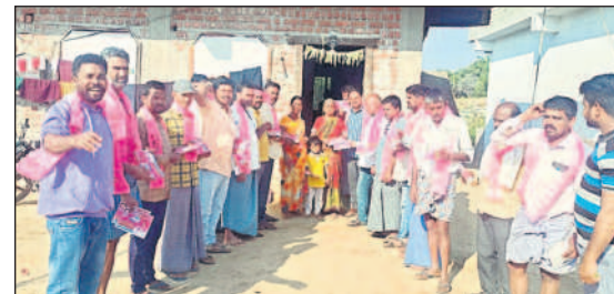
చంద్రపల్లి: దేవుని తండాలో ఓటు అభ్యర్థిస్తున్న యువజన విభాగం నేతలు