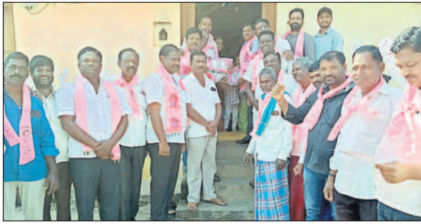
గంభీరాపురం: దమ్మన్నపేటలో ఓటు అభ్యర్థిస్తున్న బీఆర్ఎస్ నేతలు