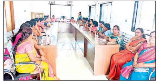
ముస్తాబాద్: సదస్సులో పాల్గొన్న ముస్తాబాద్ మహిళా నేతలు