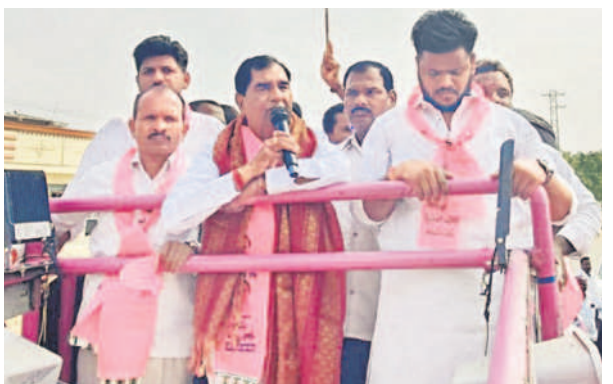
ఫరూఖ్ నగర్ మండలంలోని ఎలికట్ల గ్రామంలోని ప్రచారంలో మాట్లాడుతున్న ఎమ్మెల్యే అంజయ్య యాదవ్