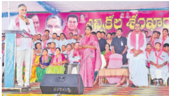
నర్సాపూర్ సభలో ప్రసంగిస్తున్న మంత్రి హాళీ రావు