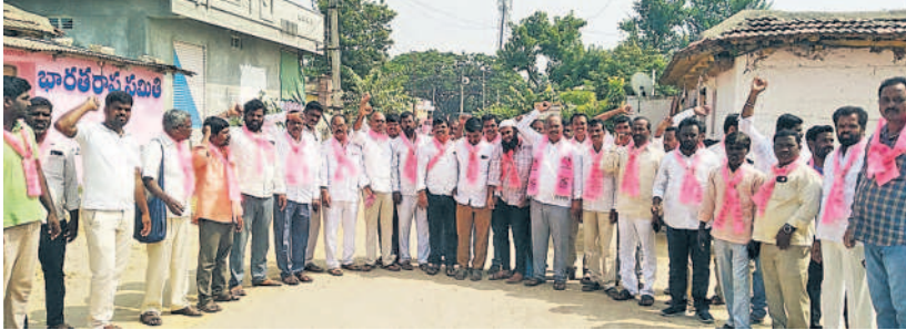
అక్కర్ పేట-భూంపల్లి మండలం ఎన్ గుర్తిలో ప్రచారం నిర్వహిస్తున్న బీఆర్ఎస్ నాయకులు