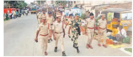
మిరుదొడ్డిలో షాగ్ మార్చ్ చేస్తున్న పోలీసులు