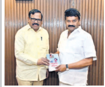
'బీసీ ఆత్మగౌరవ భవనాలు పుస్తకాన్ని ఆవిష్కరిస్తున్న మంత్రి శ్రీనివాస్ యాదవ్