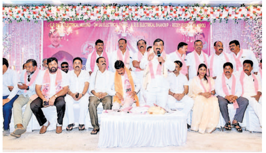
సమావేశంలో మాట్లాడుతున్న మంత్రి మహేందర్ రెడ్డి