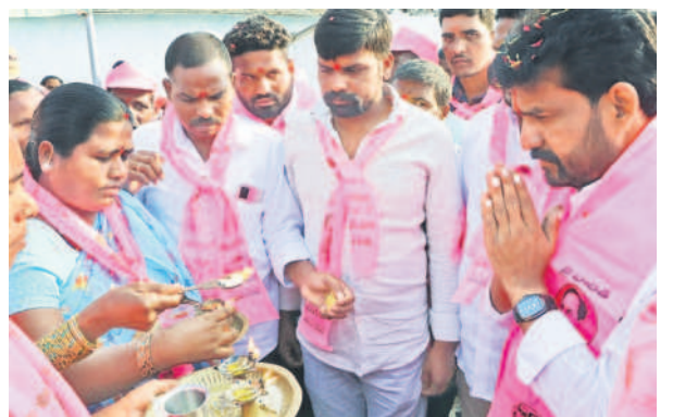
వికారాబాద్ మున్సిపల్ పరిధిలోని బూర్గుపల్లిలో ఎమ్మెల్యే మెతుకు ఆనంద్ కు హారతి పడుతున్న మహిళలు