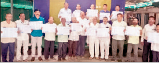
మహాజనసభ కరపత్రాలను ఆవిష్కరిస్తున్న నాయకులు