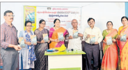
'మనసెందుకో' సున్నితం' పుస్తకాన్ని ఆవిష్కరిస్తున్న సాహితీవేత్తలు