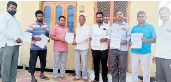
ఆహ్వాన పత్రాలను అందజేస్తున్న జిల్లా కమిటీ సభ్యులు