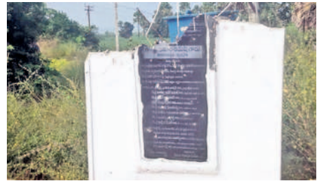
గుర్తుతెలియని వ్యక్తులు ధ్వంసం చేసిన శిలాఫలకం

ఐనవోలు, అక్టోబర్ 29: మండలంలోని నర్సింహులగూడెంలో రోడ్డు నిర్మాణ శిలాఫలకాన్ని గుర్తుతెలియని వ్యక్తులు ధ్వంసం చేశారు. రూ.2.39కోట్ల పంచాయతీరాజ్ నిధులతో నర్సింహులగూడెం నుంచి కొండపల్లికి బీటీ రోడ్డు నిర్మించారు. ఇందుకు ఈనెల 5న ఎమ్మెల్యే అరూరి రమేష్ రోడ్డు ప్రారంభించి శిలాఫలకాన్ని ఆవిష్కరించారు. శనివారం రాత్రి గుర్తుతెలియని వ్యక్తులు ధ్వంసం చేశారు. గ్రామ పంచాయతీ కార్యాలయ కుంటూరి బాబు ఫిర్యాదు మేరకు కేసు నమోదు చేసుకొని దర్యాప్తు చేస్తున్నట్లుగా ఎస్సె నవీన్ కుమార్ తెలిపారు.