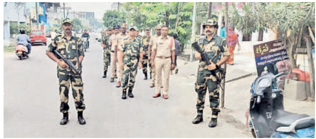
పెద్దమ్మగడ్డ-యాదవనగర్ రోడ్డులో కవాతు నిర్వహిస్తున్న కేంద్ర బలగాలు