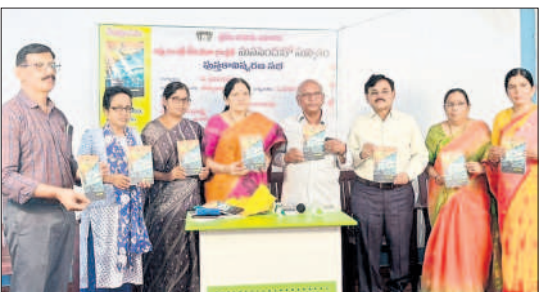
'మనసెందుకో సున్నితం' పుస్తకాన్ని ఆవిష్కరిస్తున్న సాహితీవేత్తలు