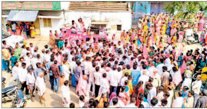
ప్రచారంలో పాల్గొన్న కార్యకర్తలు, ప్రజలు