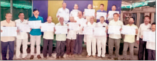
మహాజనసభ కరపత్రాలను ఆవిష్కరిస్తున్న నాయకులు