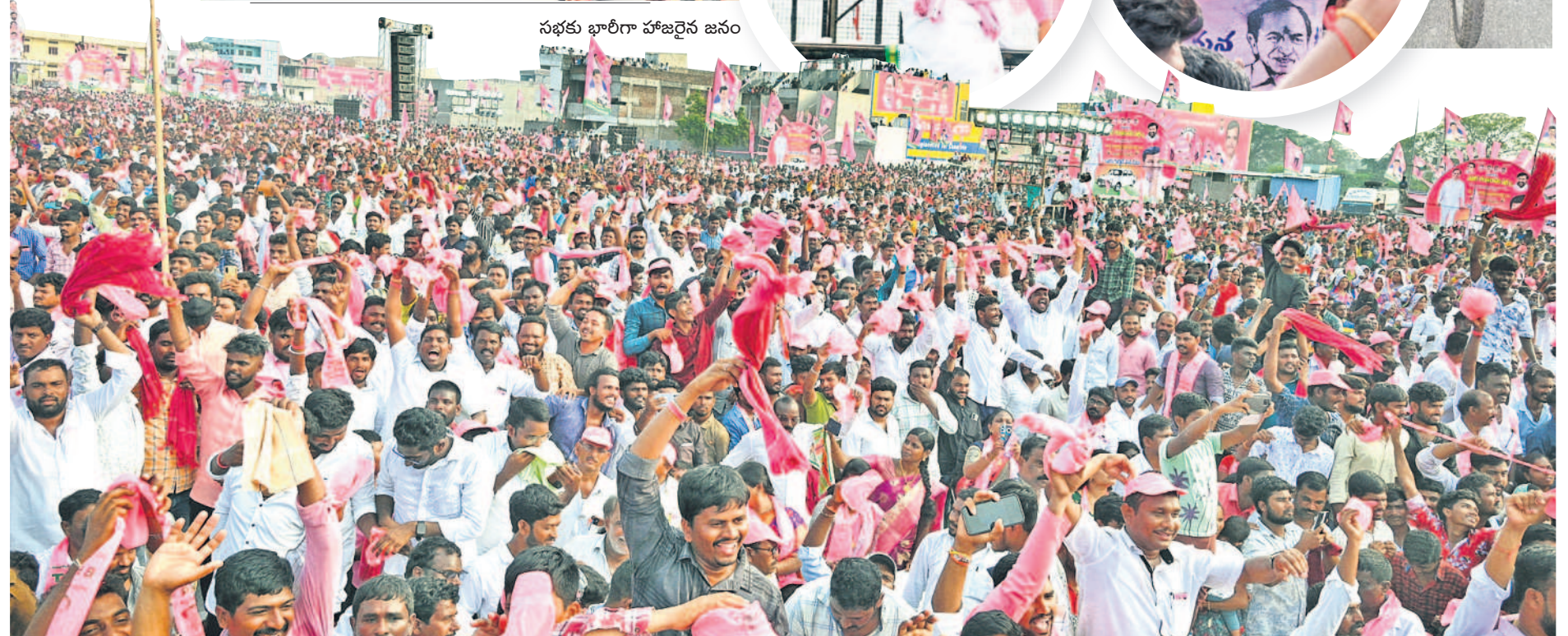
సభకు భారీగా హాజరైన జనం