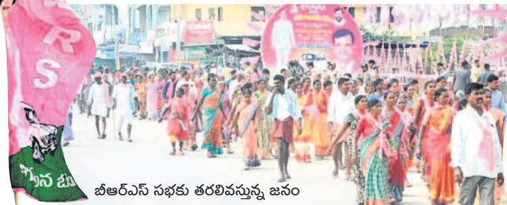
బీఆర్ఎస్ సభకు తరలివస్తున్న జనం

సభా ప్రాంగణం నిండిపోవడం తో బయట కూర్చోని సీఎం ప్రసంగం వింటున్న జనం