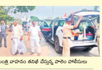
మంత్రి వాహనం తనిఖీ చేస్తున్న పాలెం పోలీసులు