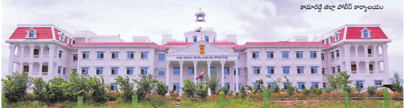
కామారెడ్డి జిల్లా పోలీస్ కార్యాలయం