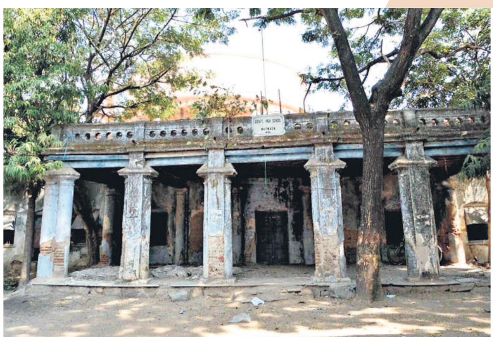
తెలంగాణ ప్రాంత ప్రజల బాగోగుల పట్ల శ్రీ పాలకులు నిర్లక్ష్యం చూపని రంగమంటూ లేదు. అలాంటి వాటిలో రాష్ట్ర అభ్యున్నతికి బాటలు వేసే విధ్య కూడా ఉన్నది. దానికి ఆనవారే ఈ చిత్రంలో కనిపిస్తున్న ప్రభుత్వ ఉన్నత పాఠశాల భవనం. వరంగల్ జిల్లాలోని మట్నాడ గ్రామంలోనిది. భూమిపండ్లను అలవిస్తూ కనిపిస్తున్న ఈ భవనంలోనే బిన్నారులు చదువుకునేవారు. ఎప్పుడు గోడలు కూలాలా.. మైక్రు ఊడి మీద చదుతుండో తెలియని స్థితిలో బిక్కుబిక్కు మంటూ పాఠాలు వినేది.