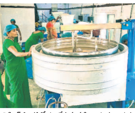
ప్రాసిసింగ్ ప్లాంట్ లో పని చేస్తున్న మహిళా సంఘాల సభ్యులు

డ్రైమిక్స్ ఇండస్ట్రీస్ లో జొన్నలు, మినుములు, వేరుశనగ, జీర, రెడ్ చిల్లీ, అవాలు,