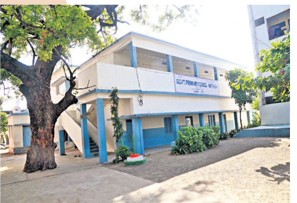
తెలంగాణ రాష్ట్రం వచ్చాక పాఠశాల విద్యకు ఎర్ర తివాచీ పరిచారు సీఎం కేసీఆర్. పిల్లలు బడి బాట పట్టాలంటే పాఠశాల భవనంతులు చక్కగా ఉండాలన్న ఉద్దేశంతో వాటి నిర్మాణాన్ని చేపట్టారు. సర్కారు బుళ్లలో నమాడు, హాజరు, ఉత్తీకత కాతాలను పెంచేలా 'మన ఊరు మన బడి' కార్యక్రమాన్ని తీసుకువచ్చారు. మట్నాడ గ్రామంలో వెలసిన పాఠశాల భవనం ఇందుకు నిదర్శనం. శుభ్రమైన పరిసరాలు.. చూడవచ్చని భవనం.. ఇప్పుడు చదువంటే ఇక్కడి పిల్లలకు పండుగ!