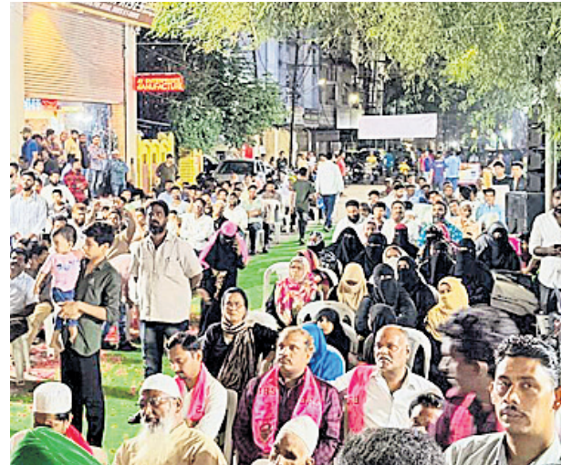
కార్యక్రమానికి హాజరైన నల్లగుట్ట ముస్లింలు

బేగంపేట్ అక్టోబర్ 30: ముస్లింల సంక్షేమానికి బీఆర్ఎస్ ప్రభుత్వం కట్టుబడి ఉందని సనత్ నగర్ ఎమ్మెల్యే, బీఆర్ఎస్ పార్టీ అభ్యర్థి తలసాని శ్రీనివాస్ యాదవ్ తెలిపారు. సోమవారం వెస్ట్ మార్కెట్ పార్కులోని తన నివాసం వద్ద సనత్ నగర్ నియోజకవర్గం పరిధిలోని ముస్లింలతో ఏర్పాటు చేసిన సమావేశంలో తలసాని మాట్లాడారు. నియోజకవర్గం అభివృద్ధికి ఎంతో కృషి చేస్తున్న బీఆర్ఎస్ పార్టీ అభ్యర్థి తలసాని శ్రీనివాస్ యాదవ్ కు ముస్లింలు తమ సంపూర్ణ మద్దతును ప్రకటించారు. తెలంగాణ రాష్ట్రం ఏర్పడిన తర్వాతనే నియోజకవర్గం పరిధిలో అనేక అభివృద్ధి కార్యక్రమాలు జరిగాయని చెప్పారు. రోడ్లు, డ్రైనేజీ, తాగునీటి సమస్యలను పరిష్కరించామని