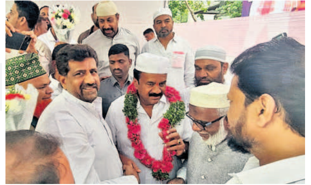
మంత్రి తలసాని శ్రీనివాస్ యాదవ్ ను సన్మానిస్తున్న ముస్లిం మత పెద్దలు

చెప్పారు. ముస్లింలు ఎదుర్కొంటున్న అనేక సమస్యలను తెలంగాణ ప్రభుత్వం పరిష్కరించి దని తెలిపారు. బేగంపేట్ లో ముస్లింల ఖబరస్థాన్ ను నిర్మించాలని ఎన్నో సంవత్సరాల నుంచి డిమాండ్ చేస్తున్నా గత పాలకులు పట్టించుకో లేదని అన్నారు. ముఖ్యమంత్రి కేసీఆర్ సహకారం తో 2 ఎకరాల స్థలం నిర్మాణ పనుల కోసం రూ.8 కోట్లు మంజూరు చేసి కలనాకారం చేసిన ఘనత తెలంగాణ ప్రభుత్వానికే దక్కుతుందన్నారు. సనత్ నగర్ అల్లావుద్దీన్ కోటిలో ఎన్నో సంవత్సరాల నుండి నివసిస్తున్న వారికి గతంలో ఉన్న ప్రభుత్వాలు పట్టాలు ఇవ్వలేదని తమ ప్రభుత్వం వచ్చిన తర్వాతనే ఇచ్చామని వారికి యాజమాన్య హక్కులు కల్పించామని తెలిపారు. అదే విధంగా హైటెన్షన్ విద్యుత్ లైన్ కారణంగా అనేక మంది ప్రాణాలు