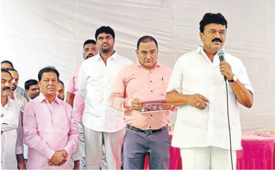
సమావేశంలో మాట్లాడుతున్న మంత్రి తలసాని శ్రీనివాస్ యాదవ్