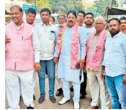
గుడిమల్యాపూర్ చౌరస్తా నుంచి బయలుదేరిన కార్యాన్ బీఆర్ఎస్ నాయకులతో మిత్రకృష్ణ

చాంద్రాయణగుట్ట, అక్టోబర్ 30 : తెలంగాణ ప్రగతి కోసం సీఎం కేసీఆర్ కృషి చేస్తున్నారని చాంద్రాయణగుట్ట