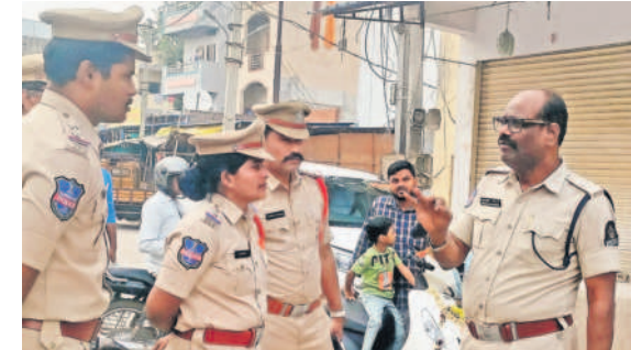
ఉప్పుగూడ తొవ్వాలబావి హనుమాన్ ఆలయం వద్ద పోలీసులకు సూచనలు చేస్తున్న అదనపు డీసీపీ షేక్ జహాంగీర్

చాంద్రాయణగుట్ట, అక్టోబర్ 30 : ఎన్నికల సందర్భంగా దక్షిణ మండలం పోలీస్ స్టేషన్ పరిధిలో సోమవారం అదనపు డీసీపీ షేక్ జహాంగీర్ ఆధ్వర్యంలో ఛత్రాచల ఏసీపీ పరిధిలో ప్రతి చౌరస్తాపై వాహనాలను తనిఖీలు చేశారు. నగదు, బంగారం, విలువైన వస్తువులు రవాణా అయ్యే అవకాశాలు ఉండటంతో పోలీసులు అప్రమత్తంగా వ్యవహరిస్తున్నారు. వాహనం తనిఖీ చేసే క్రమంలో కెమెరాలను ఉపయోగిస్తున్నారు. అదనపు డీసీపీ షేక్ జహాంగీర్ మాట్లాడుతూ.. వారం రోజులుగా దక్షిణ మండలం పరిధిలో అన్ని ఏసీపీ కార్యాలయాల అధికారులతో కలిసి తనిఖీలు నిర్వహిస్తున్నామన్నారు. ఫ్లాగ్ మార్చ్ నిర్వహించి ప్రజల్లో మేం ఉన్నామనే ధైర్యం నింపామని, ఎన్నికలు పూర్తి అయ్యే వరకు తనిఖీలు కొనసాగితాయని స్పష్టం చేశారు.