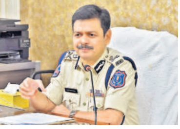
మూడు షిఫ్ట్లలో సిబ్బంది పనిచేస్తున్నారన్నారు. ప్రతి నియోజకవర్గానికి 3 ఫ్లెయింగ్ స్టాండ్స్ ఏర్పాటు చేశామన్నారు. ఎన్నికల నేపథ్యంలో నిర్వహిస్తున్న తనిఖీల్లో రూ. 36 కోట్ల విలువైన సొత్తు పట్టుబడినట్లు తెలిపారు.

సిటీబ్యూరో, అక్టోబర్ 30 (నమస్తే తెలంగాణ): రాచకొండ పోలింగ్ కమిషనర్ పరిధిలో చేపట్టిన తనిఖీల్లో ఇప్పటి వరకు రూ. 36 కోట్ల సొత్తు పట్టుబడిందని కమిషనర్ డీఎస్ చౌహాన్ వెల్లడించారు. సోమవారం విలేజ్ రుల సమావేశంలో ఆయన ఎన్నికలకు సంబంధించిన బంధోపస్థును వివరించారు. కమిషనర్ పరిధిలోని 13 నియోజకవర్గాలు ఉండగా.. మొత్తం 3,326 పోలింగ్ స్టేషన్లు ఉన్నాయన్నారు. 8 నియోజకవర్గాలకు సంబంధించిన నామినేషన్ కేంద్రాలు (ఎన్నికల రిటర్నింగ్ అధికారి కార్యాలయాలు) రాచకొండ పరిధిలోకి వస్తాయని, అక్కడ పటిష్ట భద్రత ఏర్పాటు చేసినట్లు తెలిపారు. ఎన్నికల ప్రచారం, ఇతర అంశాలకు సంబంధించిన అనుమతుల కోసం ఎన్నికల రిటర్నింగ్ అధికారి (ఆర్.ఓ.)కి 48 గంటల ముందు దరఖాస్తు చేసుకోవాలన్నారు. ఏసీపీ స్థాయిలోని నోడల్ అధికారి పరిశీలన తరువాత అనుమతులు జారీ చేస్తారన్నారు. ఇందుకు సీ విజిల్ యావీను కూడా ఉపయోగించుకోవచ్చన్నారు. కమిషనర్ పరిధిలో 19 చెక్ పోస్టులు, 24 గంటల పాటు