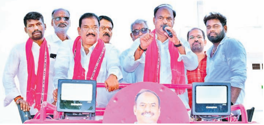
గద్వాల మండలం చెనుగోనివల్లిలో నిర్వహించిన ప్రచారంలో మాట్లాడుతున్న ఎమ్మెల్యే బండ్ర కృష్ణమోహన్ రెడ్డి