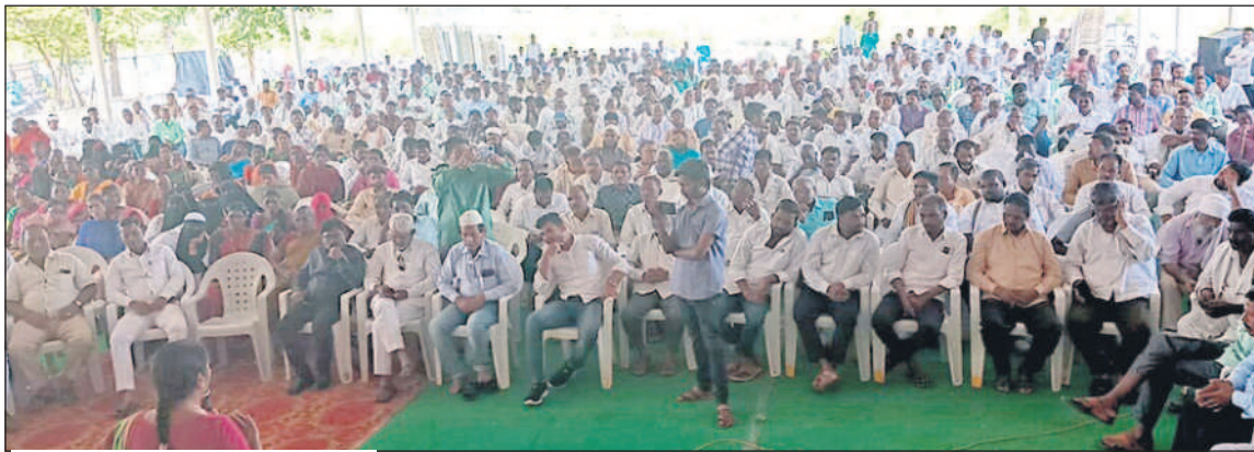
ఆదిలాబాద్లో జరిగిన సమావేశానికి హాజరైన కార్యకర్తలు