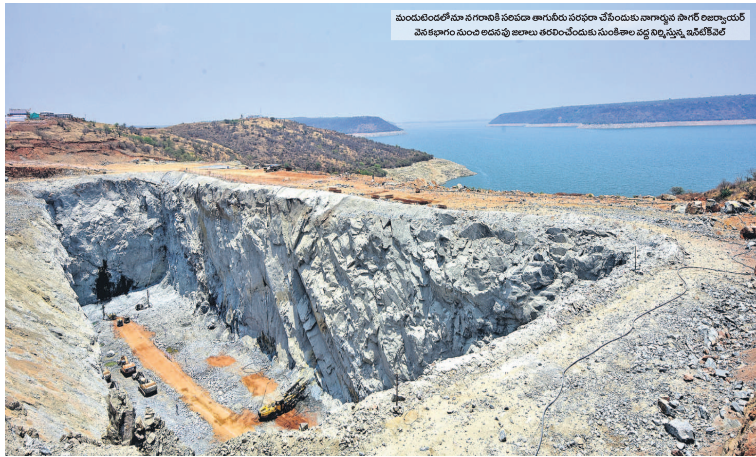
మందుబెండలోనూ నగరానికి సరిపడా తాగునీరు సరఫరా చేసేందుకు నాగార్జున సాగర్ రిజర్వాయర్ వెనకభాగం నుంచి అడనపు జలాలు తరలించేందుకు సుంకిశాల వద్ద నిర్మిస్తున్న ఇన్టీకేవెల్

6&7 సమస్త తెలంగాణ హైదరాబాద్, మంగళవారం 31 అక్టోబర్ 2023