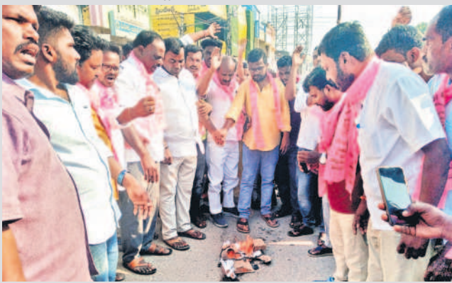
దుబ్బాకలో బీజేపీ ఎమ్మెల్యే రఘునందన్ చిత్రపటాన్ని దహనం చేసే నిరసన తెలుపుతున్న బీఆర్ఎస్ శ్రేణులు

రోడ్డుపై బైరాయింది ఆందోళనలు చేపట్టిన బీఆర్ఎస్ శ్రేణులు సూరంపల్లి ఘటనపై బీఆర్ఎస్ నేతల సీరియస్ మిన్నంటిన ఆందోళనలు, నిరసనలు చేమకు సైతం హానిచేయని ప్రజానేతకు ఇలా జరగడంపై ఆవేదన చెందిన ప్రజలు