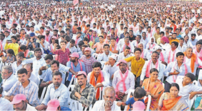
సీఎం కేసీఆర్ ప్రసంగాన్ని ఆసక్తిగా వింటున్న జనం