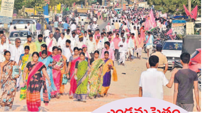
సీఎం కేసీఆర్ సభకు వస్తున్న ప్రజలు