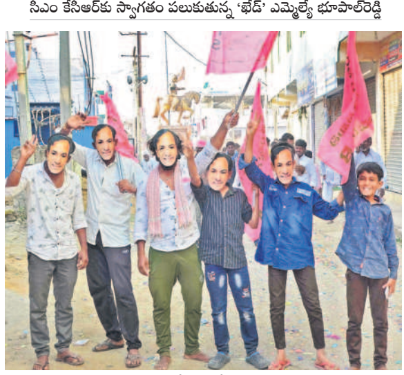
వెల్లువెత్తిన అభిమానం: సీఎం కేసీఆర్ మాన్యులతో యువత