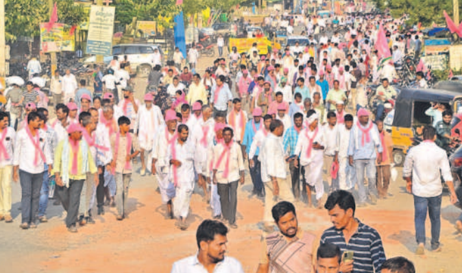
అన్ని దారులు నారాయణభేడ్ వైపు: అభిమాన నేతల చూడడానికి వస్తున్న జనం