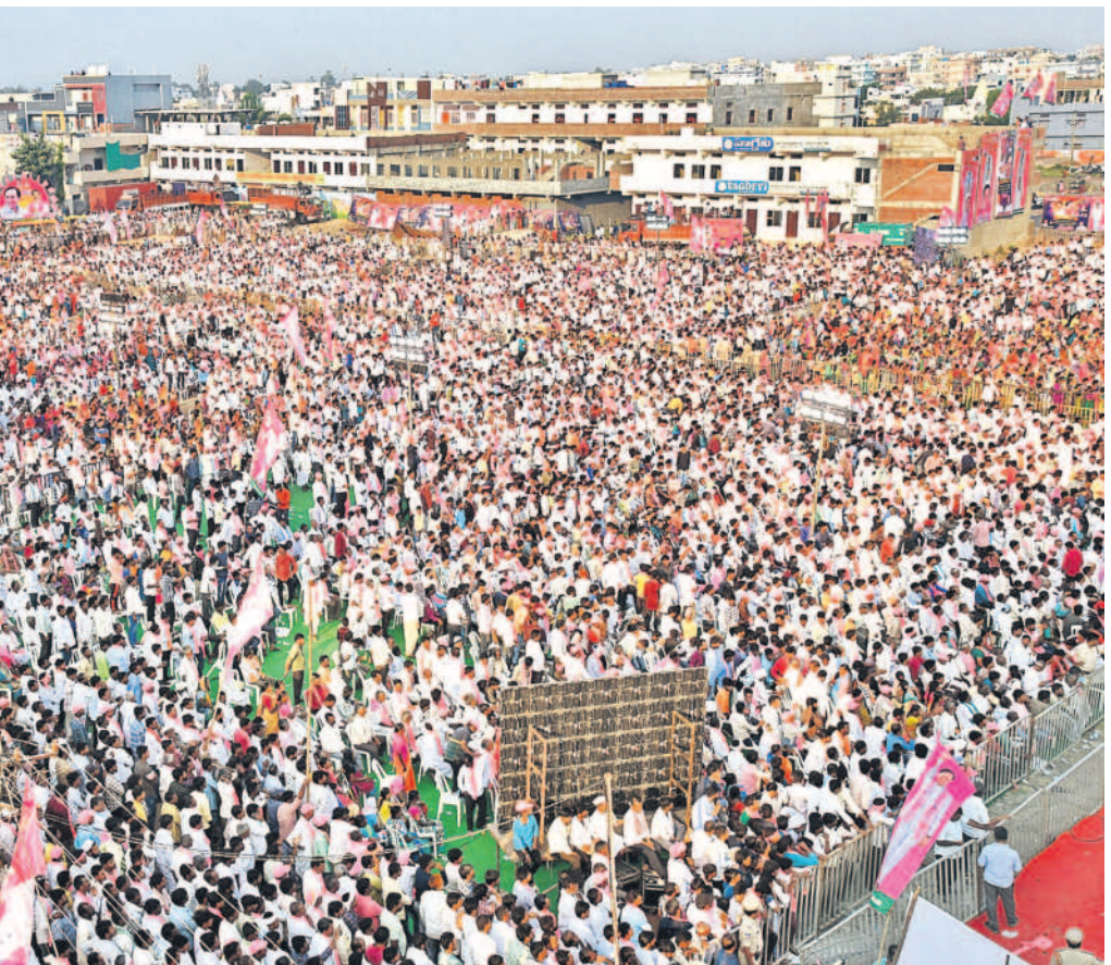
అంతస్తులు ఎక్కిన అభిమానం: ప్రజా ఆశీర్వాద సభకు హాజరైన జనం

-సిద్దిపేట, (నమస్తే తెలంగాణ ప్రతినిధి)/సంగారెడ్డి/నారాయణభేడ్, అక్టోబర్ 30