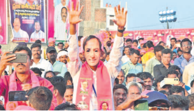
నేను సైతం: అభిమాన నేత సీఎం కేసీఆర్ ఫస్ట్ మాన్యుతో ఓ కార్యకర్త