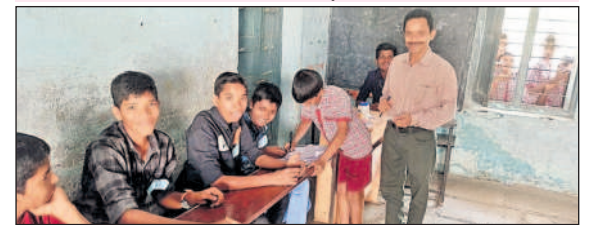
రామాయంపేట ప్రభుత్వ బాలుర ఉన్నత పాఠశాలలో మాక్ పోలింగ్ నిర్వహిస్తున్న టీచర్లు