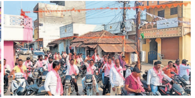
కొత్త ప్రభాకర్ రెడ్డిపై దాడికి నిరసనగా నార్సింగి మండల కేంద్రంలో బైక్ ర్యాలీ