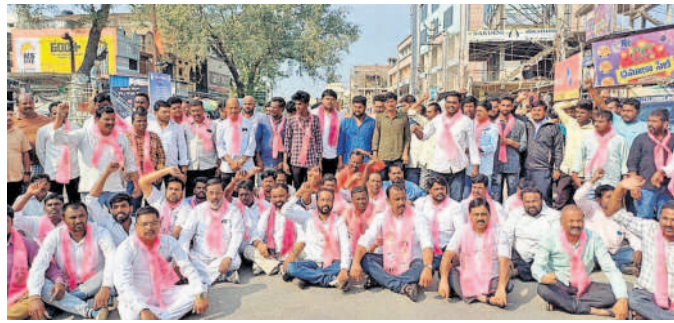
చేగుంటలో గాంధీ చౌరస్తా వద్ద నిరసన వ్యక్తం చేస్తున్న బీఆర్ఎస్ నాయకులు