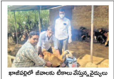
ఖాజీపల్లిలో జీవాలకు టీకాలు వేస్తున్న వైద్యులు