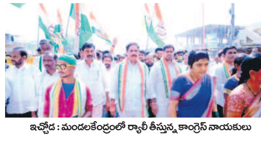
ఇచ్చోడ : మండలకేంద్రంలో ర్యాలీ తీస్తున్న కాంగ్రెస్ నాయకులు