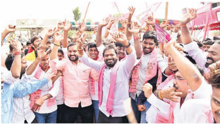
జిల్లా కేంద్రంలో కార్యకర్తలతో కలిసి నృత్యం చేస్తున్న మంత్రి శ్రీనివాస్ గౌడ్