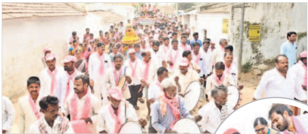
మంత్రి శ్రీనివాస్ గౌడ్ కు స్వాగతం పలుకుతున్న ప్రజలు

మహబూబ్ నగర్ టౌన్/పాల మూరు, అక్టోబర్ 30 : ఎవరెన్ని కుట్రలు పన్నినా.. ప్రజలకు చేసిన మంచే మమ్మల్ని మూడోసారి అధికారంలోకి తీసుకొస్తుందని ఎక్సైజ్, క్రీడా శాఖల మంత్రి శ్రీనివాస్ గౌడ్ అన్నారు. మహబూబ్ నగర్ మండలం తువ్వగడ్డ తండా, ఫతేపూర్, భవానీతండా, రైతుల కడుపుకొట్టేలా రైతుబంధును పల్లెగడ్డతండా, బోడబండతండాలో మంత్రి ఎన్నికల ప్రచారం నిర్వహించారు. ఆయా గ్రామాలకు వెళ్లిన మంత్రికి మహిళలు బోనాలతో ఘన స్వాగతం పలికారు. ఈ సందర్భంగా ఆయన మాట్లాడుతూ, కర్ణాటకలో అక్కడి ప్రజలు కాంగ్రెస్ ను నిమ్మితే నిండా ముంచేశారని, కనీసం కరెంటు ఇవ్వడం చేతకావడం లేదన్నారు. దీంతో రైతులంతా నష్టపోయి రోడ్లెక్కి నిరసన తెలుపుతున్నారన్నారు. రైతుల సంక్షేమానికి ప్రభుత్వం పాటుపడుతుండగా..