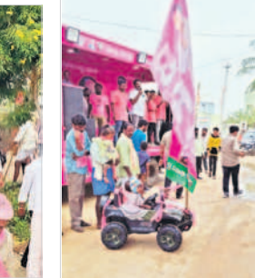
బీఆర్ఎస్ జెండాతో చిన్నారులు