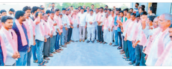
మంత్రి, ఎమ్మెల్యే సమక్షంలో బీఆర్ఎస్ లో చేరుతున్న కాంగ్రెస్ కార్యకర్తలు

కోడంగల్, అక్టోబర్ 30 : బీఆర్ఎస్ లో కొనసాగుతున్న రోజువారి జోరు చేరికలతో కాంగ్రెస్ కు హాడతెత్తుతుందిని, కాంగ్రెస్ లో చేరేవారు లేక పోవడంతో కాసుగోలు వ్యాపారం చేస్తున్నట్లు మంత్రి పట్నం మహేందర్ రెడ్డి అన్నారు. సోమవారం పట్టణంలోని మంజూనాథ బ్లాంకెట్ హాల్ లో నియోజకవర్గంలోని మద్దూర్ మండలంలోని చెన్నారెడ్డిపల్లి, మలేరెడ్డిపల్లికి చెందిన కాంగ్రెస్ కార్యకర్తలు మంత్రి మహేందర్ రెడ్డి, ఎమ్మెల్యే పట్నం నరేందర్ రెడ్డి సమక్షంలో 900ల మంది కాంగ్రెస్, బీజేపీ కార్యకర్తలు బీఆర్ఎస్ పార్టీలో చేరారు.