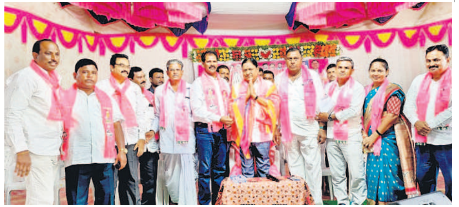
డోర్నకల్లో ఎమ్మెల్యే రెడ్డానాయక్ను సన్మానిస్తున్న బీఆర్ఎస్ నాయకులు